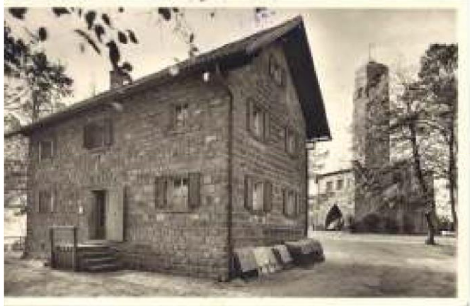
Postkarte um das Jahr 1960