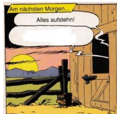
"s" + Sechstes Wort

Es ist kein Schild vor Ort, man muss den Punkt in der Wanderkarte suchen.